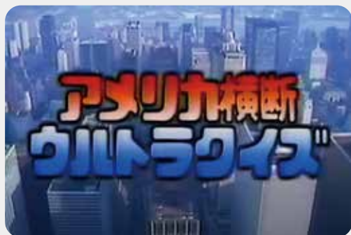
1977 アメリカ横断 ウルトラクイズ