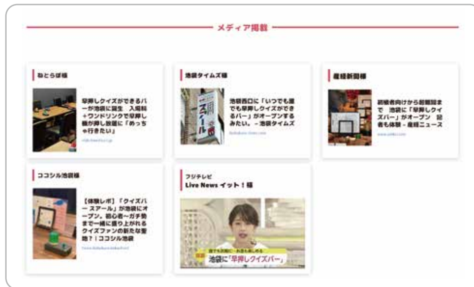
テレビも含めた多数のメディア掲載実績